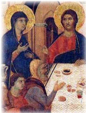
Il segno alle nozze di Cana.